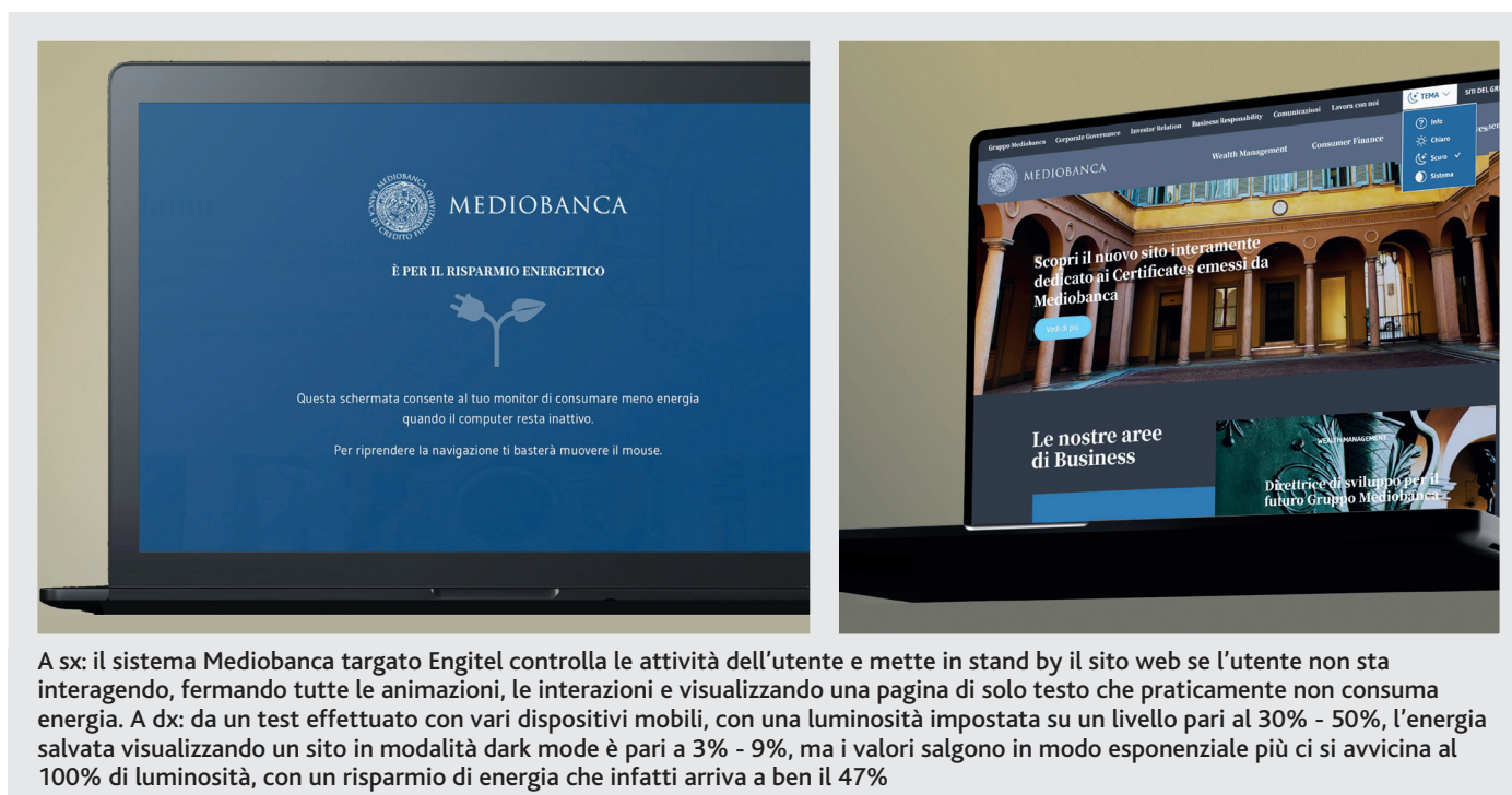
A sx: il sistema Mediobanca targato Engitel controlla le attività dell'utente e mette in stand by il sito web se l'utente non sta interagendo, fermando tutte le animazioni, le interazioni e visualizzando una pagina di solo testo che praticamente non consuma energia. A dx: da un test effettuato con vari dispositivi mobili, con una luminosità impostata su un livello pari al 30% - 50%, l'energia salvata visualizzando un sito in modalità dark mode è pari a 3% - 9%, ma i valori salgono in modo esponenziale più ci si avvicina al 100% di luminosità, con un risparmio di energia che infatti arriva a ben il 47%

corso alla prenotazione del parcheggio, fino al rimborso spese del guidatore. La piattaforma, sviluppata con grande attenzione alla UX, non è solo un sofisticato tool per condividere i viaggi, ma anche uno strumento di distribuzione di incentivi e supporto al welfare aziendale e alla responsabilità sociale. A luglio 2024, BePooler ha stretto un accordo triennale con Engitel e con Citec di Ginevra, leader europeo nella mobilità, pianificazione urbana, gestione e regolamentazione dei trasporti, per rafforzare la propria, riconosciuta, leadership tecnologica. Dopo una fase transitoria in cui BePooler darà in uso la propria piattaforma e il proprio marchio a Engitel e Citec, le forze convergeranno in un'unica realtà societaria destinata a